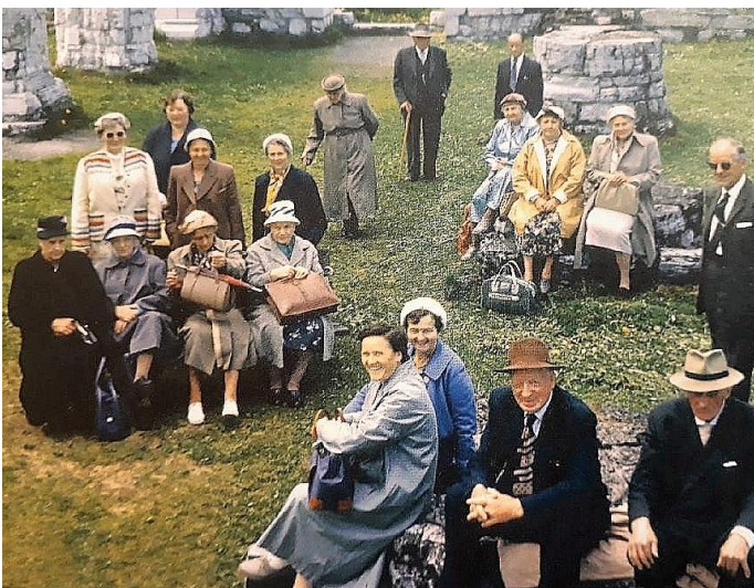
Bildet er fra sykepleieforeningens tur til Domkirkeodden 1962. Noen som kjenner igjen noen?