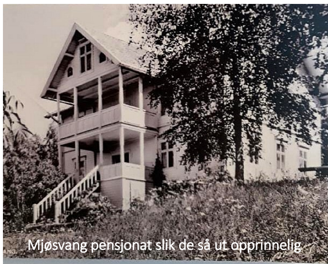
Mjøsvang pensjonat slik de så ut opprinnelig

Vi hadde med oss kaffe, men alt var så bløtt rundt oss, så vi tok kaffe og kringle inne på trappefabrikken. Her hadde jeg bilder av alle pensjonatene, og det var mulig å se Mjøsvang, Baneminde, Sollia, Solstrand og Neptun Hotel . Felles for alle var at de hadde en flott beliggenhet med storslagen utsikt. Det var svært mange stamgjester på disse pensjonatene. De som lå langs gamlevegen hadde også utleie til de vegfarende. Baneminde har i tillegg ei spesiell historie med de russiske krigsfangene under 1. verdenskrig. Mange gjester var på besøk på setrene oppe i almenningen og det var stor stas å gå opp til Knukberget. Det var mange unge jenter og gutter som jobbet på pensjonatene, og det var mye å gjøre.