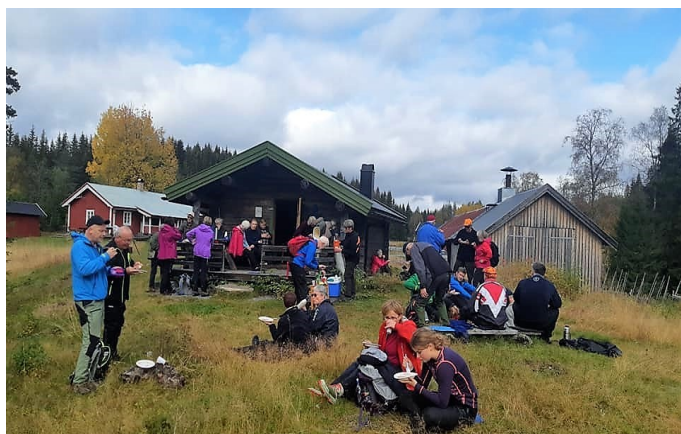
Det smakte med rømmegrøt på Gammelsaga

Veldig moro at så mange ville være med på turen. Espa turstilag / Ole